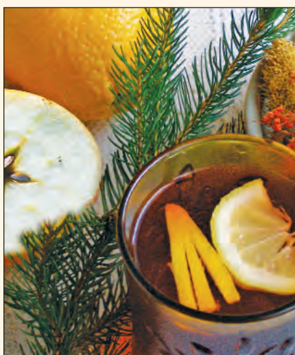
Ohnivý anglický punč