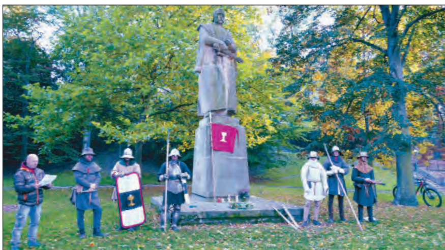
U sochy Jana Žižky v Hradci Králové se sešli 11. 10. členové ČSBS, LKŽ a další občané, aby si spolu se skupinou Tesák ze Všestaru připomněli den úmrtí velkého středověkého vojevůdce. Skupina předvedla husitskou zbroj, zbraně i způsoby boje.