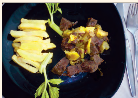
Jablečné dančí kostky

* Sous vide – potravinu (maso) vaříme zavakuované při nízkých teplotách více hodin. Může být marinované.